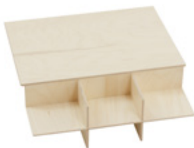
Z085 BASE CON DIVISORI