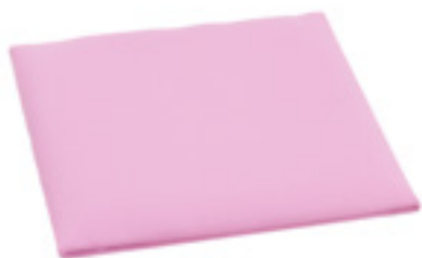
Z082 BASE IMBOTTITURA