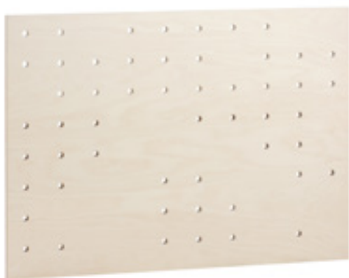
Z005M SCHIENA FORATA