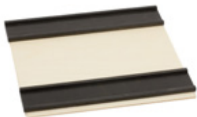
Z098 PISTA DIRITTA