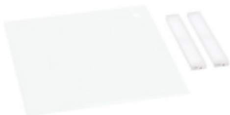
Z088 SET RIPIANO LUMINOSO (plexiglass satinato + 2 luci Led)