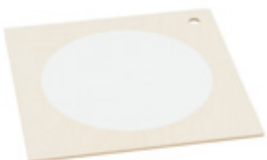
Z084 BASE MAGNETICA (con lamiera bianca)