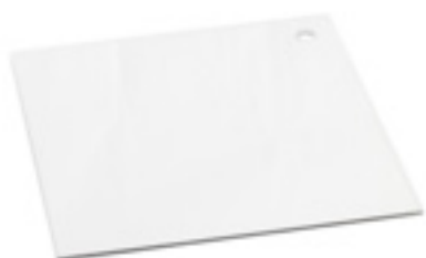
Z086 BASE CON SPECCHIO (plexiglass)