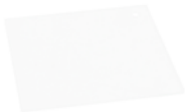
Z087 BASE TRASPARENTE (plexiglass)