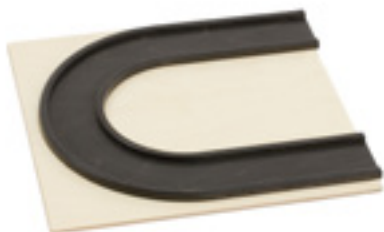
Z097 PISTA CURVA