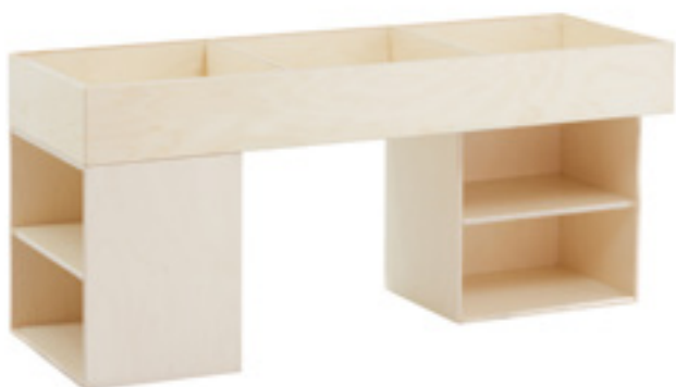
Z001M MODULO (2 basi - 1 vasca)