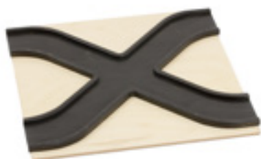
Z099 PISTA INCROCIO